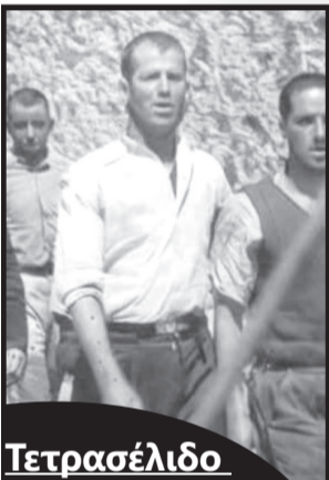
Τετρασέλιδο ένθετο: Με αφορμή τις φωτογραφίες των 200 της Καισαριανής