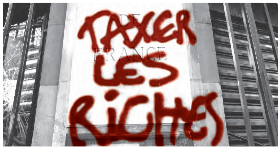
«Φορολογήστε τους πλούσιους»

Δεύτερον, διότι η επικύρωση του νόμου από το Συνταγματικό Συμβούλιο συναντάει τα πολιτικά όρια των συνδικαλιστικών ομοσπονδιών, που δυσκολεύονται να εξέλθουν του κάδρου της αστικής νομιμότητας, των θεσμών, της αστικής δημοκρατίας. Από την