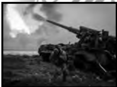
Η απειλή του πολέμου πιο κοντά από ποτέ - στα πρόθυρα ενός Γ' Π.Π.