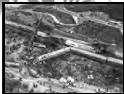
Μαθητικές κινητοποιήσεις για το έγκλημα στα Τέμπη