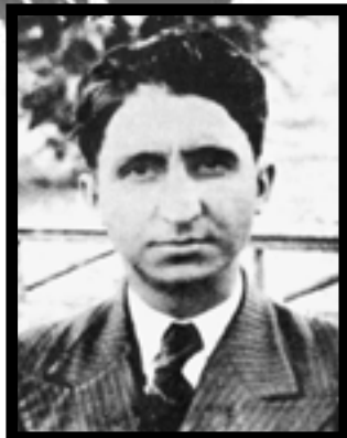
80 χρόνια από την εκτέλεση του Π. Πουλιόπουλου