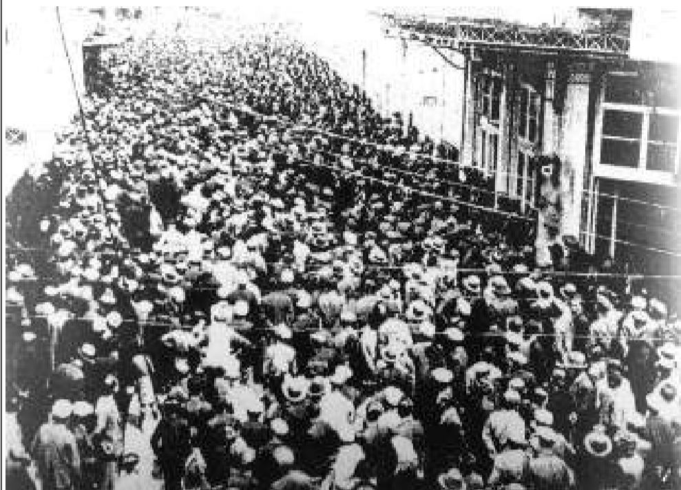
▲ Μία από τις μεγαλύτερες απεργιακές συγκεντρώσεις του Μάη '36 στη Θεσσαλονίκη

Η Πρωτομαγιά καθιερώθηκε ως διεθνής ημέρα της εργατικής τάξης στο ιδρυτικό Συνέδριο της Δεύτερης Διεθνούς, στις 20 Ιουλίου 1889. Τα γεγονότα του Σικάγο το 1886 συγκλόνισαν το παγκόσμιο προλεταριάτο και την καθιέρωσαν ως μέρα πάλης και μνήμης για το διεθνές εργατικό κίνημα. Στην Ελλάδα, η Πρωτομαγιά σημαδεύτηκε από αποφασιστικούς και ηρωικούς αγώνες εργατών και από αιματοκυλίσματα απεργών και επαναστατών.