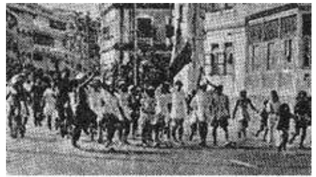
Naval Mutiny in Bombay

Στις 24 Φεβρουαρίου, η εξέγερση είχε ηττηθεί. Λευκές σημαίες υψώθηκαν σε όλα τα πλοία και η κεντρική απεργιακή επιτροπή εξέδωσε την τελευταία της ανακοίνωση στην οποία έγραφε: «Η εξέγερσή μας απο-