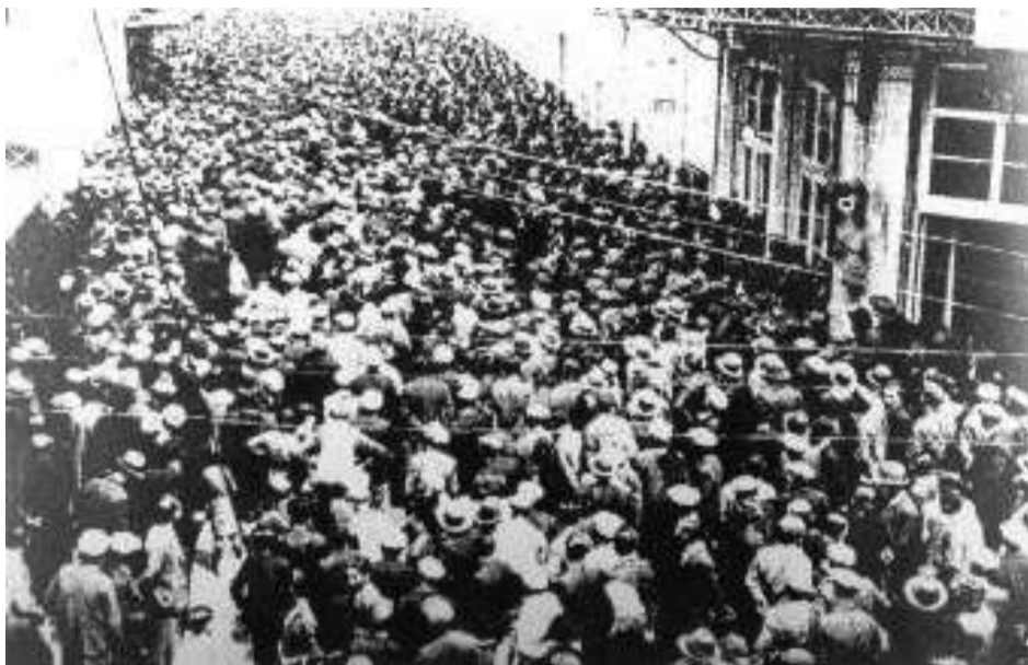
▲ Μία από τις μεγαλύτερες απεργιακές συγκεντρώσεις του Μάη '36 στη Θεσσαλονίκη

Η Πρωτομαγιά, παγκόσμια μέρα μνήμης και αγώνα ενάντια στην καπιταλιστική εκμετάλλευση, καθιερώθηκε στη συνείδηση των εργαζομένων όλο του κόσμου ως μέρα σύμβολο της πάλης τους, έπειτα από την ηρωική εξέγερση των εργατών του Σικάγο τον Μάη του 1886. Η παγκόσμια απήχησή της δεν θα μπορούσε να αφήσει ανεπηρέαστο το ελληνικό εργατικό κίνημα, το οποίο δεν άργησε να οργανώσει τις δικές του Πρωτομαγίες.