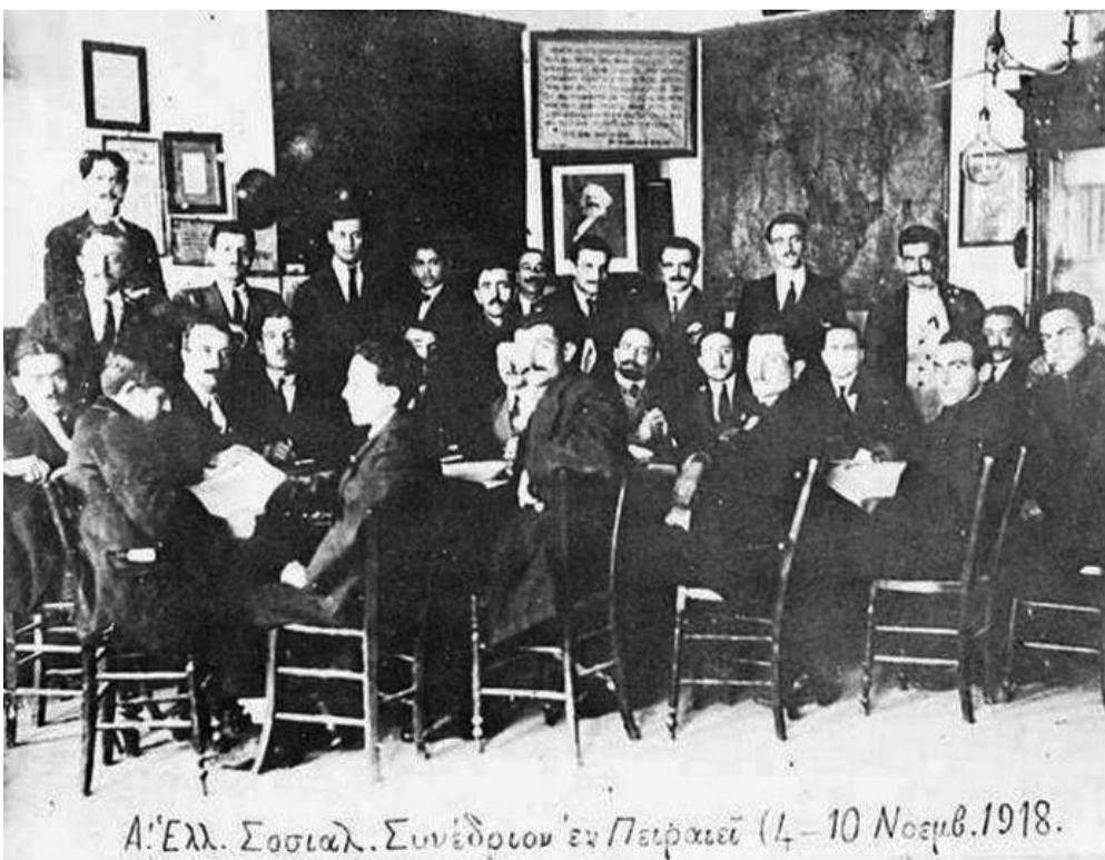
Α' Έλλ. Σοσιαλ. Συνέδριον εν Πειραιά (4-10 Νοεμβ. 1918.)

Στα 1924 στο Γ' Έκτακτο Συνέδριο του ΣΕΚΕ(Κ) μετονομάζεται σε Κομμουνιστικό Κόμμα Ελλάδας (ΚΚΕ) και ο Παντελής Πουλιόπουλος εξελέγη Γενικός Γραμματέας, πρώτος στην ιστορία του.