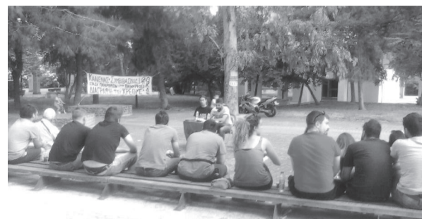
▲ Από την εκδήλωση της Ο.Κ.Δ.Ε. στις εργατικές πολυκατοικίες του Ταύρου, 13/06/2015

Όλα τα παραπάνω δείχνουν ότι έχουμε μπει σε πορεία σύγκρουσης. Έτσι, για την Ο.Κ.Δ.Ε. η οργάνωση (πολιτικά και πρακτικά) των εργαζομένων και των αγωνιστών γίνεται επιτακτικό καθήκον. Η καμπάνια μας δεν είχε έναν γενικό χαρακτήρα, αλλά την ανάδειξη ενός προγράμματος αντιμετώπισης της έκτακτης κατάστασης, διεξόδου από την κρίση, ενός αναγκαίου όσο ποτέ σχεδίου αγώνων. Μιας χρήσιμης επιλογής, που με τις καλύτερες δυνατές εγγυήσεις παρέχει το πρόγραμμα και η πρακτική της Ο.Κ.Δ.Ε., για να βγούμε από τον σημερινό βάλτο.