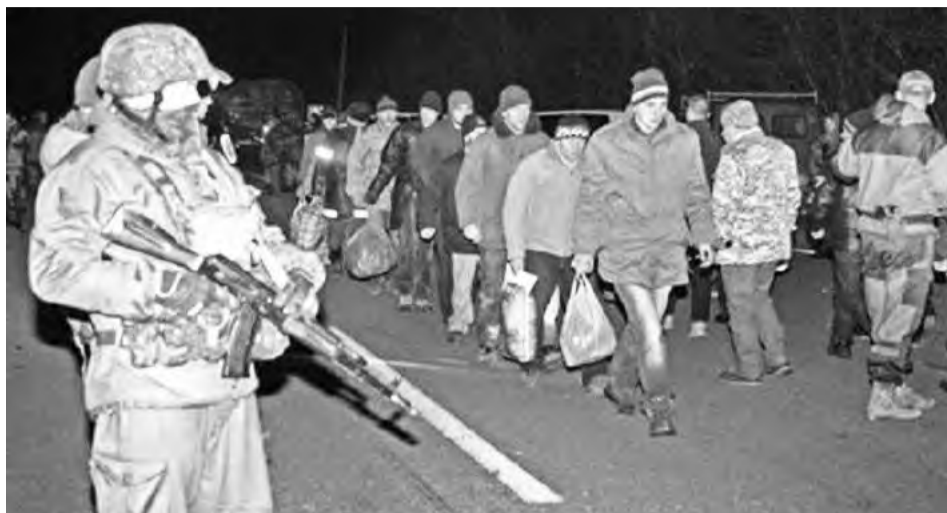
▲ Ανταλλαγή αιχμαλώτων μεταξύ Κιέβου και ανταρτών αυτονομιστών

Παράλληλα, οι εξαγγελίες των φασιστών δείχνουν την κατεύθυνσή τους το επόμενο διάστημα. Ανέγερση φράκτη μήκους 2.000 χιλιομέτρων –κατά μήκους των συνόρων με την Ρωσία–, τον οποίο