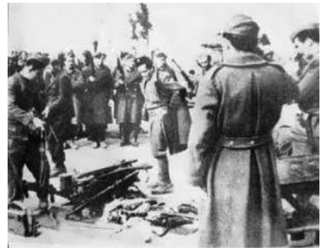
▲ Η συγκλονιστική στιγμή της παράδοσης των όπλων από τους δακρυσιμένους αντάρτες

Με τη συμφωνία του Λιβάνου (17-20 Μαΐου 1944), ο ΕΛΑΣ έμπαινε υπό την ηγεσία της «ενιαίας κυβερνήσεως», το ΕΑΜ δεχόταν να συντονίζει τις ενέργειές του μ' αυτές των Άγγλων, ενώ καταδικαζόταν η «τρομοκρατία στην ύπαιθρο». Με τη συμφωνία της Καζέρτας (26 Σεπτεμβρίου 1944), ο ΕΛΑΣ τίθονταν υπό την ηγεσία της κυβέρνησης Εθνικής Ενότητας και, μέσω αυτής, του βρετανού αξιωματικού Σκόμπι, δεσμευ-