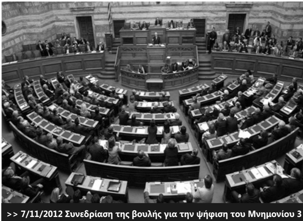
>> 7/11/2012 Συνεδρίαση της βουλής για την ψήφιση του Μνημονίου 3

Η κυβέρνηση προσπαθεί να παραμείνει με νύχια και με δόντια στην εξουσία –φυσικά με την πλήρη στήριξη τραπεζιτών, επιχειρηματιών κλπ- ασκώντας μια πολιτική που βασίζεται πάνω στο ψέμα και στον φόβο. Κατ' αρχήν μας βομβαρδίζει