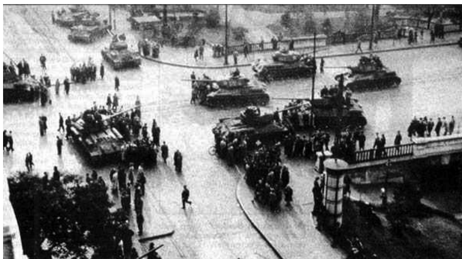
^ 1956: Τα ρωσικά τανκς στην Βουδαπέστη

Μετά το θάνατο του Στάλιν το 1953, στα πλαίσια της «αποσταλινοποίησης» που προωθούσε η νέα γραφειοκρατική ηγεσία του Νικίτα Χρουστσόφ, ο Ράκοζι απομακρύνθηκε προσωρινά και η νέα κυβέρνηση του Ίμρε Νάγκι παραχώρησε κάποιες ελευθερίες, που όμως κρίθηκαν «υπερβολικές» από τη Μόσχα, με αποτέλεσμα την καθάρωση του Νάγκι. Ωστόσο, η μερική χαλάρωση του καθεστώτος επέτρεψε τη δημιουργία ενώσεων φοιτητών και διανοουμένων, οι οποίες διεκδικούσαν λογοτεχνικές και πολιτικές ελευθερίες και στιγμάτιζαν την οικονομική και κοινωνική κατάσταση της Ουγγαρίας, παίζοντας σημαντικό ρόλο στην ιδεολογική προετοιμασία της εξέγερσης. Το Σεπτέμβριο του 1956 άρχισαν να σχηματίζονται εργατικές επιτροπές, με αιτήματα τη δημοκρατική λειτουργία των συνδικάτων και την καθιέρωση του εργατικού ελέγχου στις αποφάσεις της διεύθυνσης. Η κύρια ένωση των διανοουμένων υιοθέτησε τα εργατικά αιτήματα, πρόσθεσε πολιτικά αιτήματα όπως απομάκρυνση του Ράκοζι από το κόμμα, ελεύθερες εκλογές και ισότητα στις σχέσεις με τη Σοβιετική Ένωση και κάλεσε σε διαδήλωση στις 23 Οκτώβρη 1956 στη Βουδαπέστη. Η πορεία κατευθύνθηκε προς την πλατεία του κοινοβουλίου. Εργάτες που γύριζαν από τη δουλειά τους και κόσμος από τις γειτονιές πύκνωνε συνεχώς τις γραμμές της. Όταν οι διαδηλωτές πληροφορήθηκαν ότι η κυβέρνηση είχε καταγγείλει τη διαδήλωση ως «ενέργεια κατά της δημοκρατίας και της εξουσίας της εργατικής