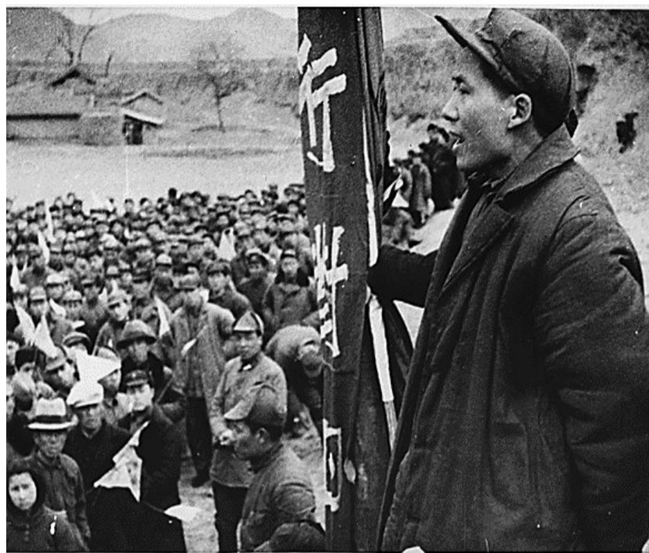
▲ Η νίκη της κινέζικης επανάστασης ήταν η πρώτη μεγάλη νίκη του προλεταριάτου στη σκακιέρα του Ψυχρού Πολέμου.

Ο χαρακτήρας του νέου κράτους ήταν εργατικός ωστόσο ήταν από την αρχή ένα κράτος γραφειοκρατικά πα-