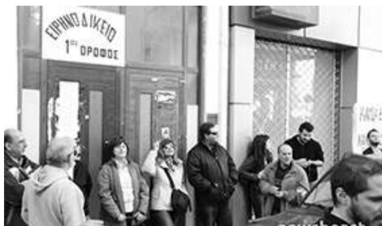
▲ Τετάρτη 2/11, Ειρηνοδικείο Περιστερίου: Ακόμη ένας πλειστηριασμός ματαιώθηκε με την κινητοποίηση κατοίκων και συλλογικοτήτων

Η κυβέρνηση και οι επικεφαλής των τραπεζών, γυμνοί και ξεμπροστιασμένοι πλέον, ήταν αυτοί που με περίσσιο θράσος και υποκρισία επέμεναν ότι δεν πρόκειται να μπουν στο στόχαστρο ευπαθείς ομάδες, που βρίσκονται σε πραγματική αδυναμία, ή τα ακίνητα οικογενειών που δεν έχουν άλλη περιουσία. Κάτι βέβαια που ήταν αναμενόμενο, αφού η προστασία για τους δανειολήπτες απέναντι στους πλειστηριασμούς - κατασχέσεις της πρώτης κατοικίας είναι πολύ περιορισμένη. Με το νόμο για τα κόκκινα στεγαστικά δάνεια (4346/2015), οι προϋποθέσεις για την προστασία της πρώτης κατοικίας είναι πολύ αυστηρές. Ουσιαστικά ένα 30% των δανειοληπτών έχει κάποια προστασία, ένα 28% μπορεί με αρκετά δυσκολότερους όρους να ενταχθεί σε ρύθμιση, και το 42% δεν έχει καμιά απολύτως προστασία. Το ζήτημα δεν κλείνει μόνο με τον ν. 4346/2015, καθώς οι τράπεζες έχουν υιοθετήσει μια άκρως επιθετική στάση, επιδιώκοντας να πουλήσουν τα κόκκινα δάνεια στα κερδοσκοπικά κεφάλαια, με κατάργηση της όποιας προστασίας των δανειοληπτών. Στο πλαίσιο αυτό η κυβέρνηση έχει ήδη νομοθέτησει το ν. 4354/2015 που επιτρέπει/θεσμοθετεί την πώληση της διαχείρισης των κάθε είδους κόκκινων δανείων σε Εταιρίες Διαχείρισης Απαιτήσεων από Μη Εξυπηρετούμενα Δάνεια (ΕΔΑΜΕΔ) , δηλαδή στα κερδοσκοπικά κεφάλαια (distress funds).