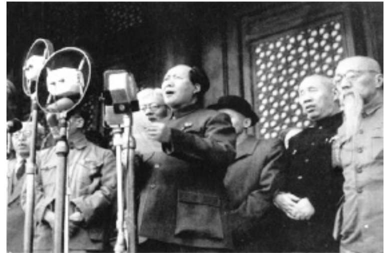
▲ Ο Μάο Τσε Τούνγκ ανακοινώνει τη δημιουργία της Λαϊκής Δημοκρατίας της Κίνας (1/10/1949)

Ήδη από το 1931, η Ιαπωνία είχε καταλάβει τη βορειοανατολική επαρχία της Μαντζουρίας. Παρόλα αυτά, η κινέζικη μπουρζουαζία, το κόμμα της και ο ηγέτης της Τσανγκ Κάι Σεκ εξακολουθούσαν να θεωρούν τους εργάτες και τους κομμουνιστές ως πιο επικίνδυνο εχθρό από τους Ιάπωνες. Το 1937, η Ιαπωνία με νέα επίθεση καταλαμβάνει τη βόρεια Κίνα και την ανατολική παραλιακή ζώνη, εξαπολύοντας τρομερές σφαγές. Η οδηγία του Στάλιν προς το ΚΚ Κίνας ήταν να σχηματίσει ενιαίο μέτωπο με το Κουόμιντανγκ και να διαλύσει τον αντάρτικο στρατό του μέσα στο στρατό του Τσανγκ. Το «μέτωπο» αυτό υπήρχε μόνο στα χαρτιά, καθώς ο Τσανγκ συνέχιζε τις επιθέσεις κατά των κομμουνιστών. Ευτυχώς για την τελική έκβαση της κινέζικης επανάστασης, ο Μάο αρνήθηκε να διαλύσει τις δυνάμεις του μέσα στον αστικό στρατό και με έξυπνη τακτική ανταρτοπόλεμου προκαλούσε μεγάλη φθορά στους Ιάπωνες. Παράλλη-