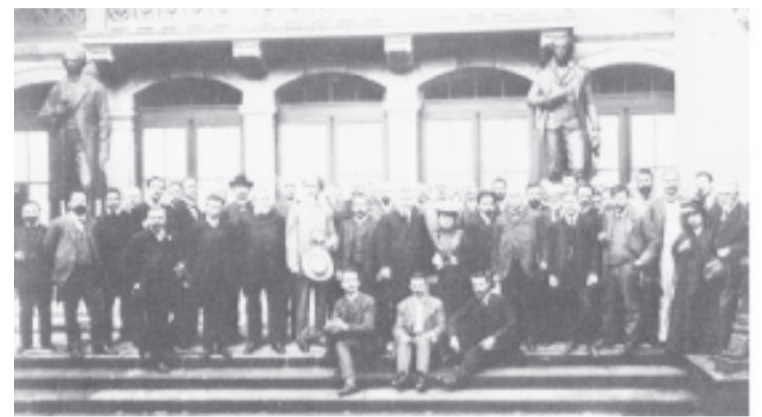
▲ 7ο συνέδριο της 2ης Διεθνούς στη Στουτγκάρδη

Όπως είναι φυσικό, το συμφέρον αυτού του στρώματος ήταν αντίθετο σε κάθε προσπάθεια ανατροπής του καπιταλισμού. Σύντομα απέκτησε και ιδεολογική έκφραση, μέσα από τις απόψεις του Μπερνστάιν, που υποστήριζε ότι το καπιτα-