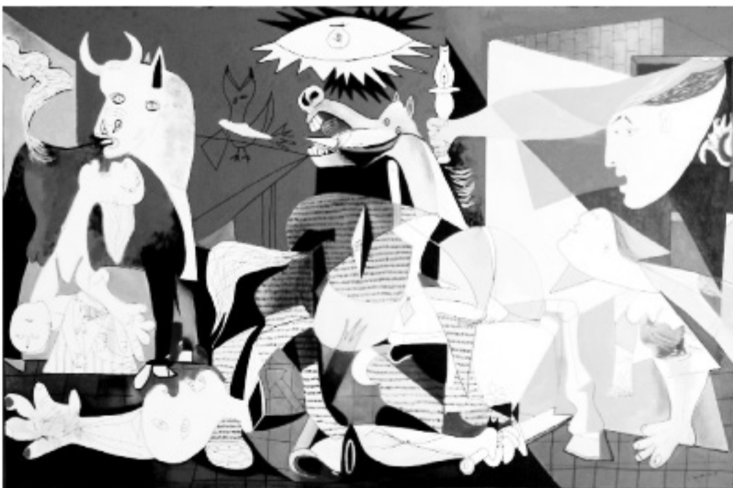
▲ Η Γκουέρνικα (1937) του Πάμπλο Πικάσο. Η μαρτυρική Γάζα είναι η σύγχρονη πόλη της Γκουέρνικα.

Σ' αυτή την εξαιρετικά κρίσιμη στιγμή, η νίκη του παλαιστινιακού λαού, η επιβολή του δικίου του κόντρα στα συμφέροντα του Ισραήλ και των ιμπεριαλιστών, εξαρτάται όχι μόνο από την ίδια την, παροιμιώδη πια, επιμονή και γενναιοσύνη του, αλλά και από την αλληλεγγύη και έμπρακτη συμπαράσταση όλων των λαών. Οι διαδηλώσεις συμπαράστασης που οργανώνονται σε όλο τον κόσμο -ακόμα και στο ίδιο το Ισραήλ- , παρά τις απαγορεύσεις και τα εμπόδια που βάζουν οι αρχές (π.χ. στο Παρίσι), πρέπει να συνεχιστούν και να ενταθούν. Η εκστρατεία που έχει ξεκινήσει για να εφαρμοστούν, παγκοσμίως, αυστηρές κυρώσεις και να μισοκταριστούν τα ισραηλινά προϊόντα, επενδύσεις κ.λπ. πρέπει να γενικευτεί και ν' ασκήσει πραγματικές πιέσεις τόσο στις κυβερνήσεις της Δύσης όσο και στο ίδιο το Ισραήλ. Η αδικία σε βάρος του Παλαιστινιακού λαού πρέπει να πάει τέλος.